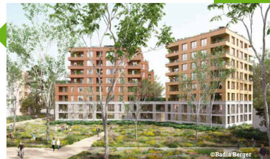
▲ Résidence Métamorphose - Image non contractuelle

relogées dans le cadre du projet de renouvellement urbain). À la suite de sa livraison prévue à l'été 2026, cette nouvelle résidence, dotée d'appartements allant du T2 au T5, offrira des prestations de qualité alliant confort et bien-être à ses futurs occupants.