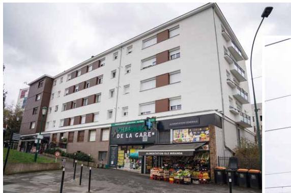
▲ 152 avenue Jean-Jaurès