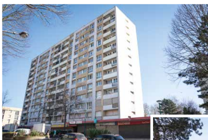
▲ 48-58 rue de Marseille