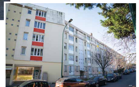
▲ 35-41 rue de Dunkerque