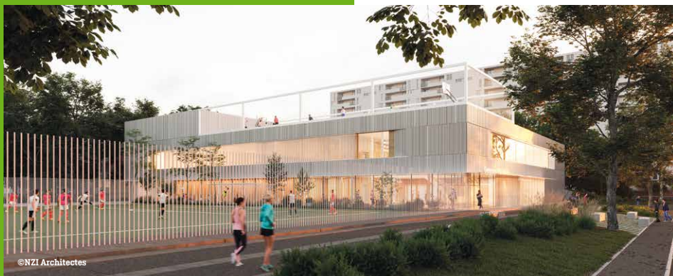
▲ Complexe sportif rue de Strasbourg - Image non contractuelle

Les gros œuvres étant achevés (fondations, structure, charpente en bois), le chantier entre dans la phase dite du second œuvre (isolation, plomberie, électricité, chemins de câble...) tout en respectant une qualité environnementale exigeante.