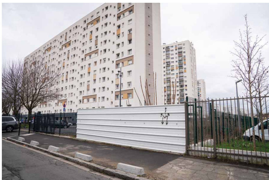
▲ Fermeture de l'allée Carpeaux

Jusqu'à présent, grâce aux jeux de sentes piétonnières, l'allée Carpeaux permettait de rejoindre à pied la rue Henri Wallon et la rue de la Justice. À la suite des travaux de résidentialisation de la copropriété du Clos des Sansonnets et du lycée Feyder, l'allée a été fermée en attendant l'aménagement d'une nouvelle voie débouchant directement sur la rue de la Justice entre les écoles élémentaires Jean-Jaurès et la maternelle Jaurès Nord. Les travaux démarreront cet automne pour une durée de trois à quatre mois.