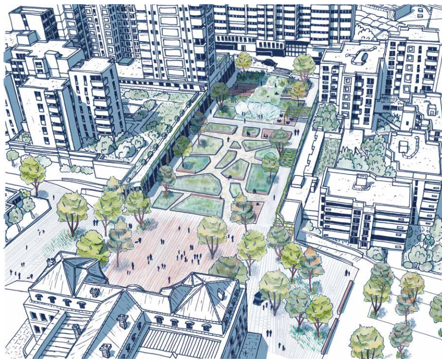
▲ Esquisse de l'esplanade requalifiée - ©AP5 - Image non contractuelle

deux ans. À terme, ce sont tous les services municipaux ouvrant au public qui seront regroupés dans un seul et même bâtiment pour fluidifier l'accueil des usagers et la prise en charge de leurs demandes. Le chantier de l'esplanade devant la mairie devrait quant à lui démarrer à la même période pour permettre une liaison facile et agréable allant de la rue de Paris aux berges de Seine . À l'horizon 2028, les Spinassiens découvriront ainsi une esplanade davantage végétalisée et plus attractive.