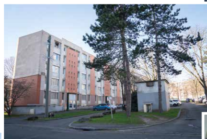
▲ Square d'Aix