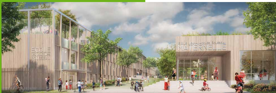
▲ Groupe scolaire Jean-Jacques Rousseau - Image non contractuelle

Pour les besoins des travaux, la maternelle et le centre de loisirs Jean-Jacques Rousseau n'accueillent plus les petits écoliers spinassiens depuis fin 2024.