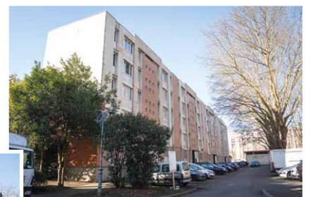
▲ Square des Anglaises