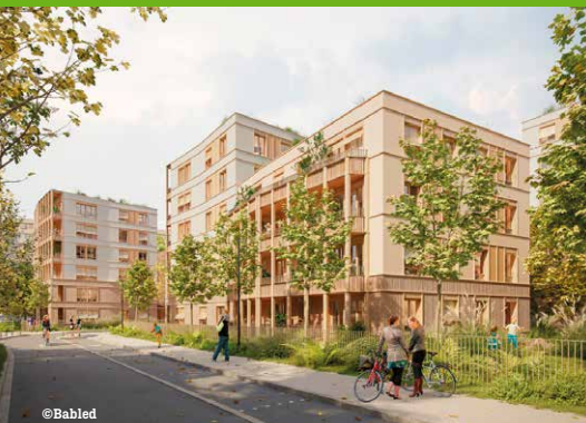
▲ Perspective des nouvelles constructions sur l'emprise du 38-50 rue du Commandant Louis Bouchet Image non contractuelle

Donner vie à un nouveau cœur de quartier et réintroduire plus de nature en ville sont deux objectifs clés prévus dans le Nouveau Programme National de Renouvellement Urbain pour La Source-Les Presles. Les prochains travaux qui vont démarrer dans les mois à venir participeront à atteindre ces objectifs.