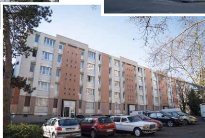
Square des Pépinières ▶