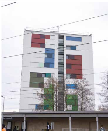
▲ Résidence rue de l'Avenir