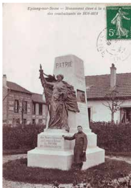
Le monument aux morts du square des Mobiles au début du XX e siècle.