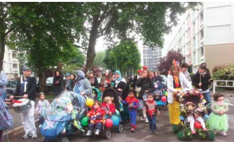
L'association des Bouts de choux d'Orgemont est très active. Ici, lors du dernier carnaval fin mai.