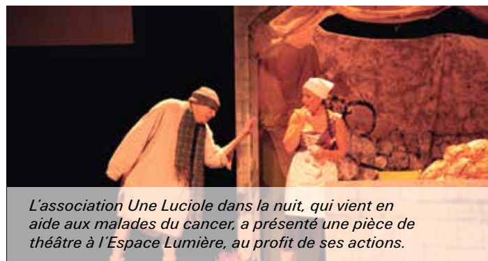
L'association Une Luciole dans la nuit, qui vient en aide aux malades du cancer, a présenté une pièce de théâtre à l'Espace Lumière, au profit de ses actions.