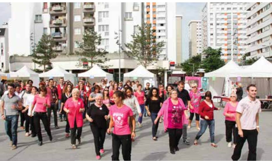
Ils l'ont fait ! À l'initiative de l'association Une Luciole dans la nuit, un flashmob a réuni une cinquantaine de participants.