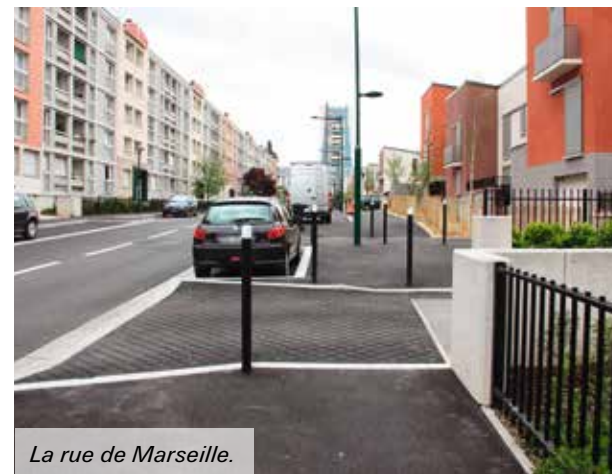
La rue de Marseille.

« La partie haute de la rue de Marseille... et les commerces. On manque de boulangeries par exemple. De toute façon, il restera toujours des choses à faire. Mais c'est sûr qu'Orgemont a déjà changé en mieux. »