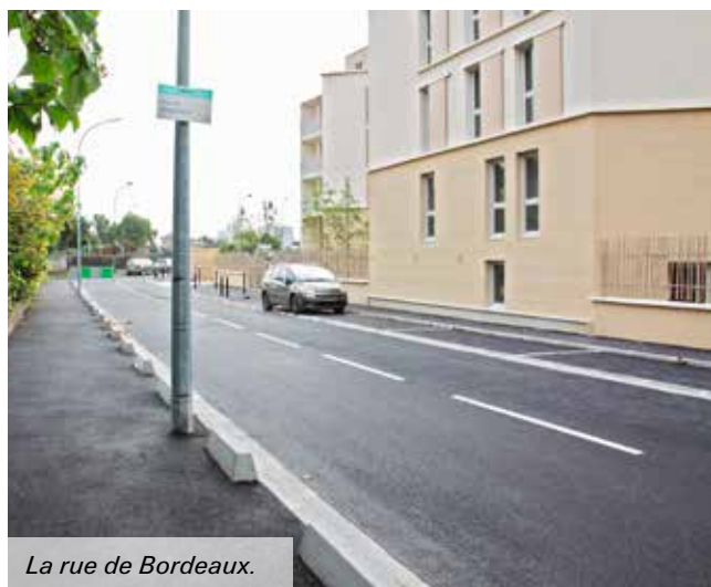
La rue de Bordeaux.