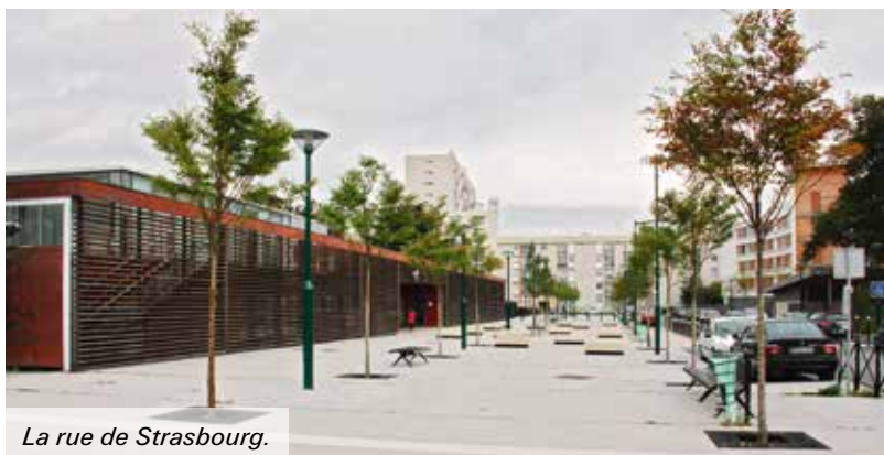
La rue de Strasbourg.

Depuis trois ans, cette rue est réaménagée par tranches successives : des arbres sont notamment plantés et des bornes installées afin d'éviter le stationnement sauvage. Une dernière tranche sera réalisée en 2014.