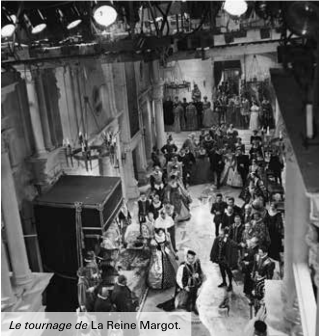
Le tournage de La Reine Margot.