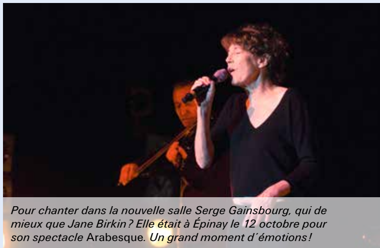
Pour chanter dans la nouvelle salle Serge Gainsbourg, qui de mieux que Jane Birkin? Elle était à Épinay le 12 octobre pour son spectacle Arabesque. Un grand moment d'émotions!