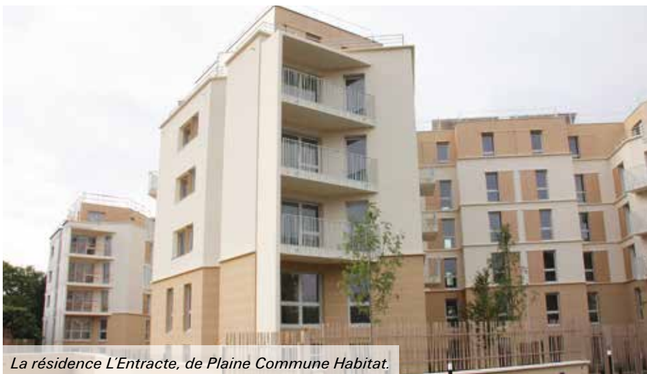
La résidence L'Entracte, de Plaine Commune Habitat.

Les 56 logements sociaux de Plaine Commune Habitat - la résidence L'Entracte -, construits à l'angle avec la rue de Dunkerque, seront livrés d'ici la fin de l'année. Suivra début 2014, la livraison de la résidence L'Avant-première, trois immeubles construits par les promoteurs Kaufman & Broad et Palladio, qui compteront 122 logements en accession libre. Cette mixité de l'habitat attire à Orgemont une nouvelle population, souvent de jeunes parents à la recherche d'un logement en proche banlieue. De quoi dynamiser encore le quartier.