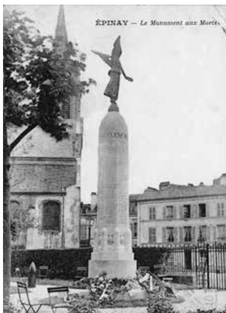
Le monument aux morts de la Première Guerre mondiale, sur la place de l'église.

Après la Seconde Guerre mondiale, la guerre d'Indochine et celle d'Algérie, près de 200 noms supplémentaires y seront malheureusement ajoutés.