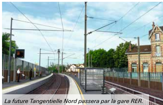
La future Tangentielle Nord passera par la gare RER.

En marge de ce chantier, la gare RER est en travaux. Il s'agit de mieux distinguer les accès voyageurs et les passages piétons. Les Spinassiens pourront ainsi passer plus facilement d'un côté à l'autre de la gare. De même, la rue du 8 Mai 1945 sera réaménagée pour faciliter l'accès à la gare.